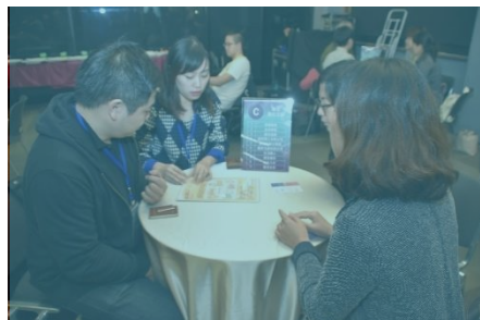
青創Pitch&Match Cultech Startup Demo show