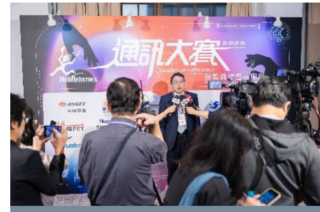
電子媒體 / 平面新聞 / 電視新聞