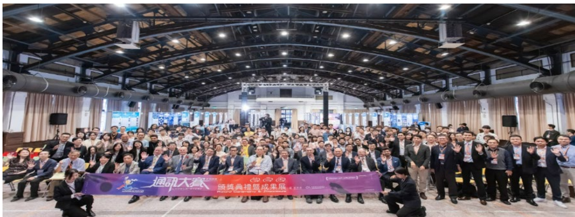
邀請署內長官、贊助廠商重量級主管頒獎勉勵優秀團隊 藉由成果展示及媒合露出，增加團隊曝光，鏈結更多資源