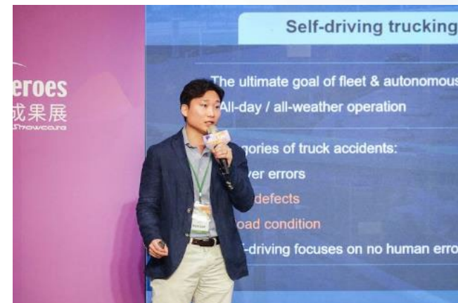
績優團隊上台pitch時間