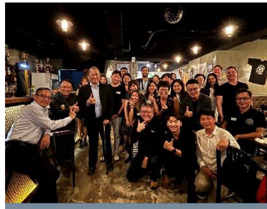
國際賽團隊交流茶會