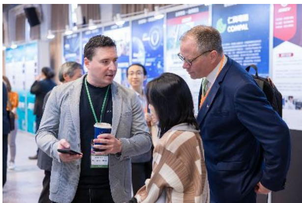
成果展示交流體驗