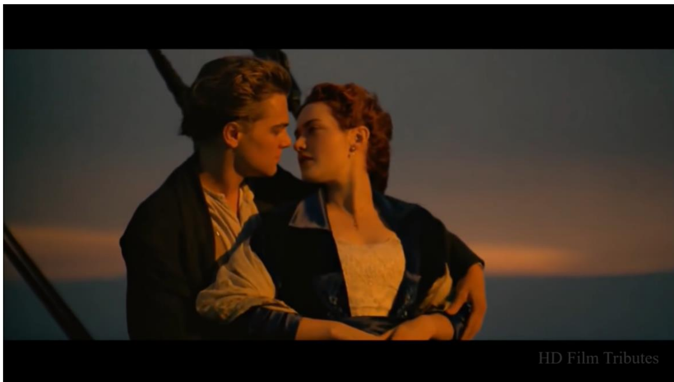
Titanic • My Heart Will Go On • Celine Dion