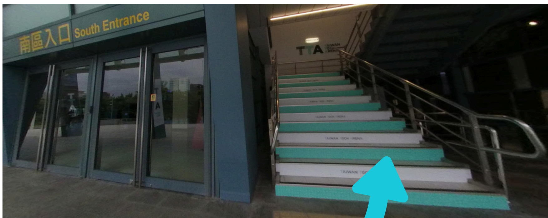
小巨蛋南側入口旁 階梯上樓