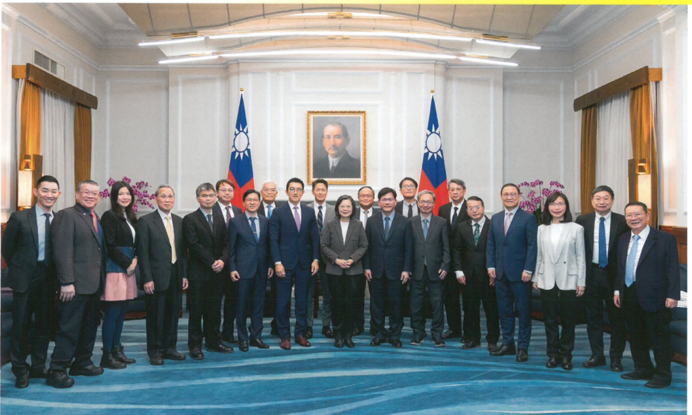
蔡英文總統接見「2023年度傑出生技產業獎」獲獎單位

生物產協年度舉辦「傑出生技產業獎」，安排於BIO Asia-Taiwan亞洲生技大會同步舉行頒獎典禮及發表，並蒙總統接見勉勵，肯定已有卓越發展之公司，並挖掘深具潛力之明日之星，期藉此帶動生技產業能量。過去獲獎企業均有極佳表現，具備國際競爭及市場拓展之實績實力，每年也能從參選及獲獎名單中，讓國際看見台灣生醫產業發展趨勢，見證產業多元發展，及優異的創新研發成果及實力展現。